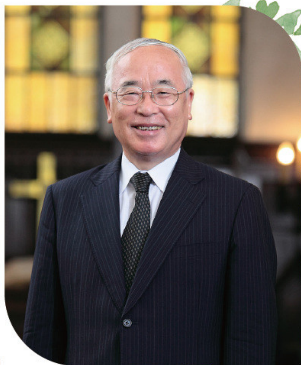
日本基督教団出版局理事長 前日本基督教団総会議長